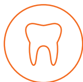
MeinZahnschutz 75 17,39 EUR 1

Den Beitragsverlauf wählen Sie bei uns selbst: Möchten Sie niedriger einsteigen oder lieber Beiträge fürs Alter ansparen und dafür jetzt etwas mehr zahlen? Sie haben die Wahl!